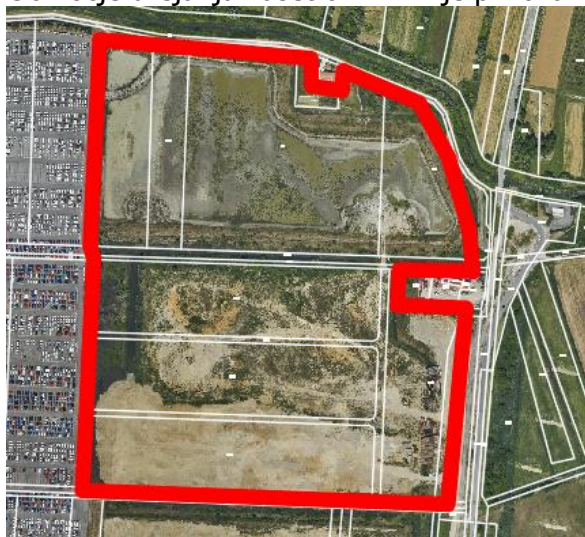
Slika 1: Območje urejanja – Kaset 6a in 7A

Območje urejanja kaset 6A in 7A je prikazano na Sliki 1.