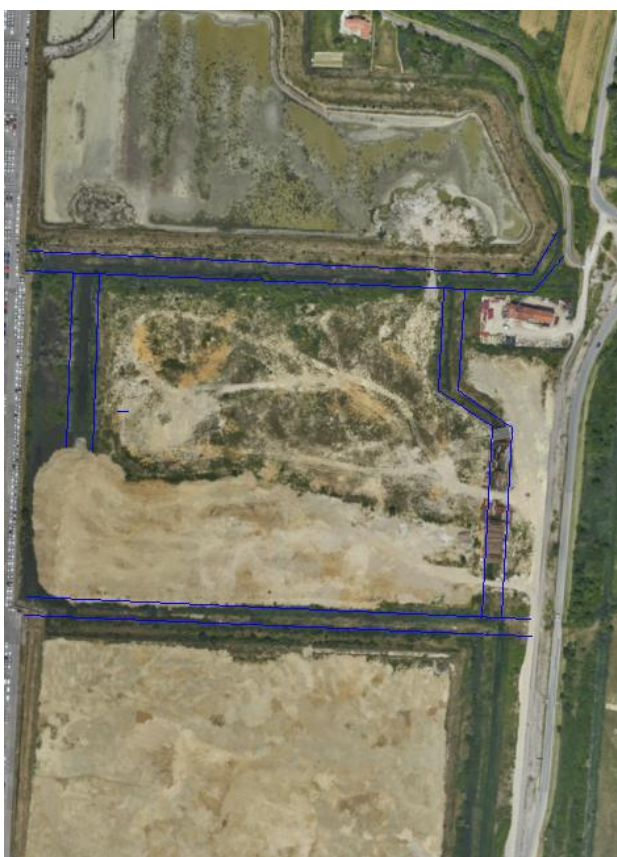
Slika 2: Odvodni jarki na območju Kaset 6A in 7A

V sklopu izdelave Državnega prostorskega načrta je bila izdelana dokumentacija: